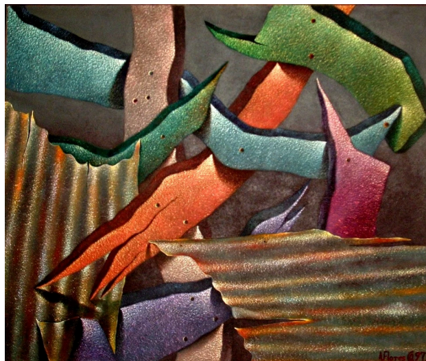
Aurelio Flores Quiros. 2008

- La incertidumbre: Hace referencia a la apertura a lo desconocido, al no poder anticipar con certeza un resultado, lo que convierte al arte en un espacio de exploración y sorpresa.