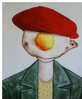
NIÑO HUEVO CON SOMBRERO ROJO (2023) Pintura de Ta Byrne.

- Lo emergente: Se refiere a lo que surge de manera inesperada dentro del proceso artístico, generando nuevas formas, significados o experiencias que no estaban previstas de antemano.