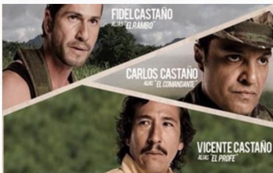
Imagen de la serie Tres caínes (Bolívar, 2013)