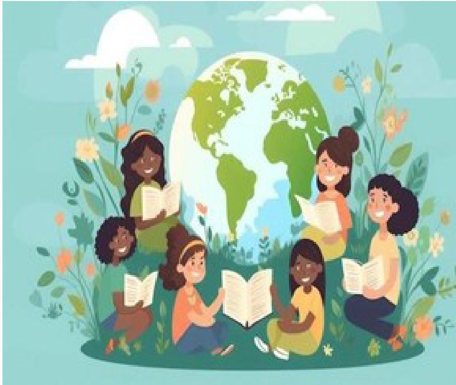
Imagen 4. Investigación comunitaria. Diseñado por Freepik