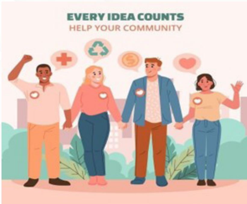
Imagen 3. Investigación comunitaria. Diseñado por Freepik